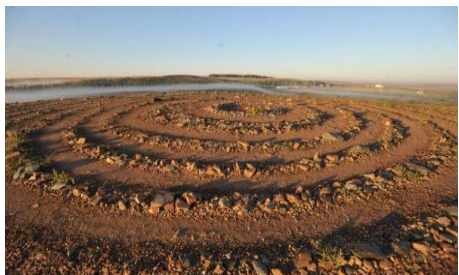
Селището Аркаим отпреди 4000г