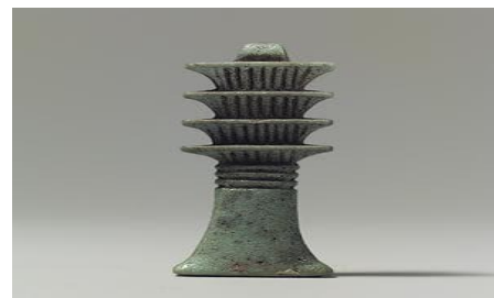
Амулет "Джед" емблема на Озирис (богът на подземния свят), около 688-332 пр.н.е.