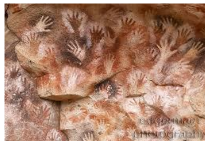
Пещерата на ръцете в Патагония

Положително и силно въздействие върху психиката имали и т.н. талисмани. Говорейки за символи, не може да се подмине и фактът, че египтяните поставяли различни предмети до мумиите по време на погребения като техни пазители [13]. Носенето на амулети от египтяните се смятало за защита, а кървавият цвят на оранжево-червения камък карнеол дарявал сила и енергия. Върху саркофагите умишлено се поставяли защитни символи за предпазване на мумиите от унищожаване.